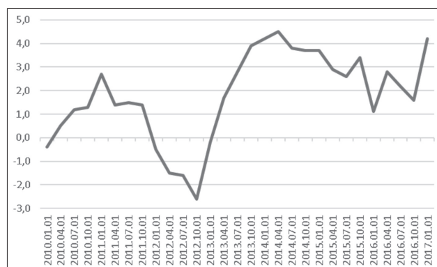
1. ábra A GDP negyedéves változása (%)

A gazdaságpolitikai lépések áttekintése után érdemes röviden áttekinteni a gazdaság fontosabb mutatóit, megvizsgálva a magyar gazdaság állapotát. A GDP 2013 első negyedévéől növekedést mutat. 2017 első negyedévébe a GDP növekedése 4,2% volt az előző év hasonló időszakához viszonyítottn.